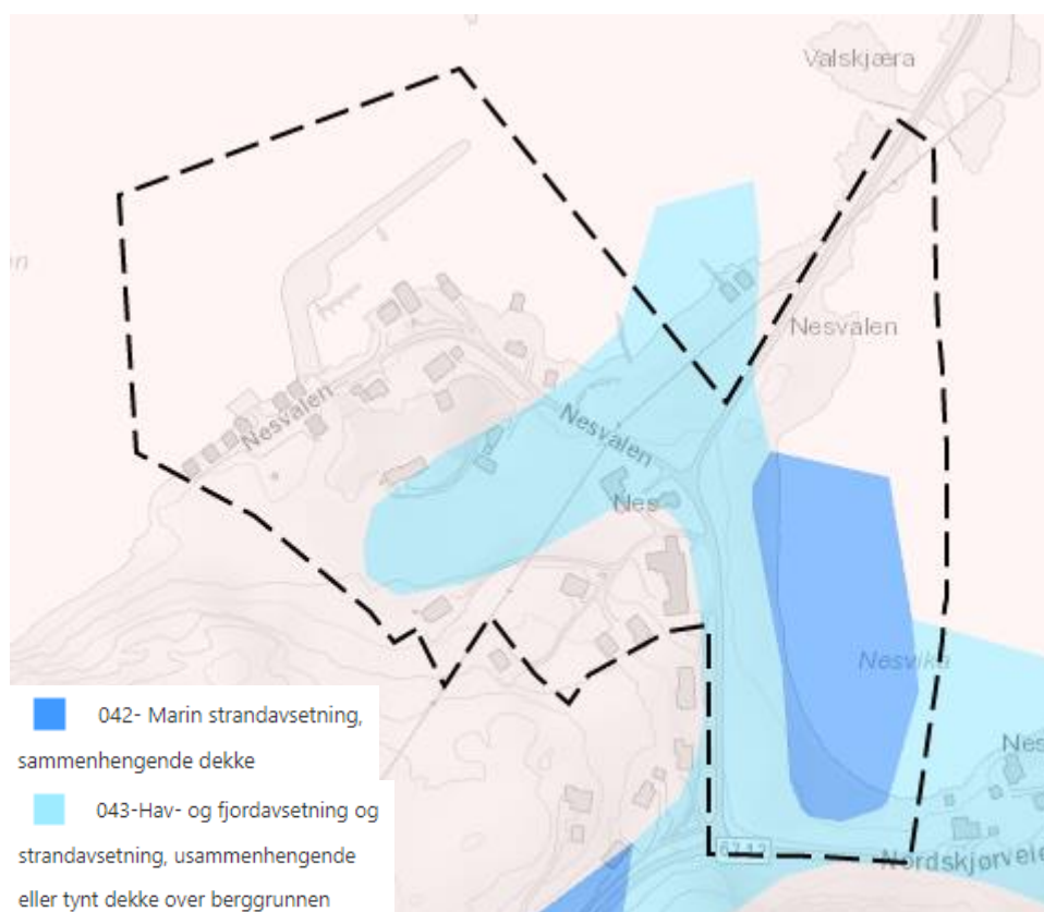
Figur 3 Løsmassekart

Kart på geo.ngu.no viser at det er svært stor mulighet for marin leire i deler av området. I dette området er det usammenhengende/tynt dekke hav- og fjordavsetning og strandavsetning og i hovedsak dyrkajord. Det er også et område i østre del av strandsonen med stor mulighet for marin leire. I resten av planområdet er marin leire stort sett fraværende.