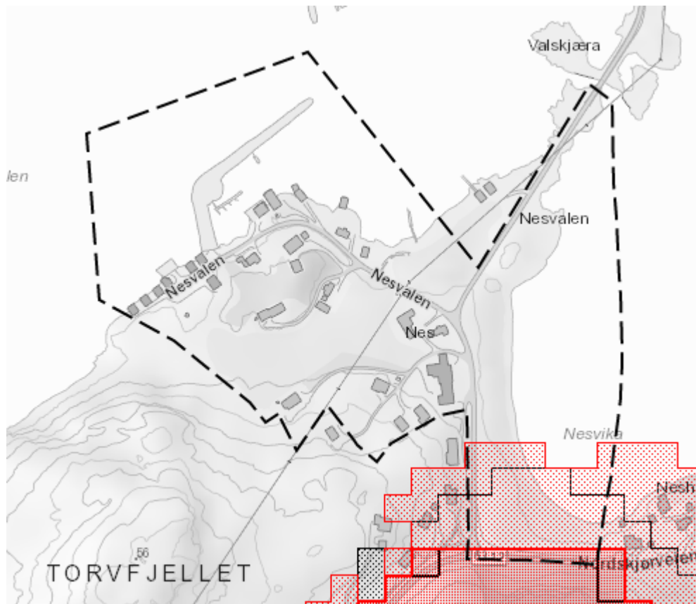
Figur 1 Aktsomhetsområde for skred.

Aktsomhetskart for steinskred, steinsprang, snø- og isskred viser at søndre del av planområdet ligger innenfor potensielt utløpsområde for steinskred og snøskred.